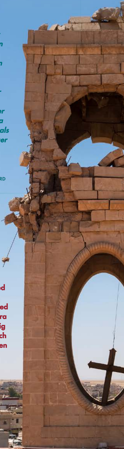
Förstörd kyrka i staden Qaraqosh i Irak