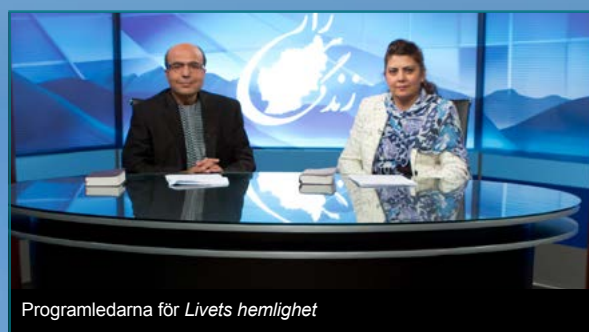
Programledarna för Livets hemlighet

I Turkiet betraktas medlemmar av religiösa minoriteter med stor misstänksamhet av majoritetssamhället, som ett hot mot nationell enhet och säkerhet. Fastän de i teorin är fria att tala, så möter de i praktiken så stora juridiska och byråkratiska hinder, att deras frihet att praktisera sin tro är mycket begränsad.