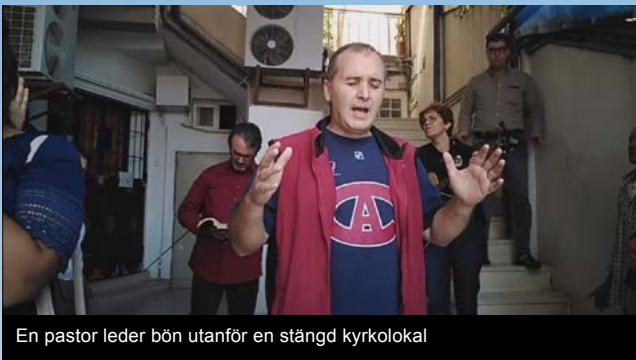
En pastor leder bön utanför en stängd kyrkolokal

I Algeriet har åtminstone tolv kristna fällts på grund av trosrelaterade anklagelser som hädelse och proselytism de senaste fem åren och har dömts till upp emot fem års fängelse. Allt som kan få människor från majoritetssamhället att ifrågasätta sin tro, eller har som syfte att introducera dem till Jesus, är förbjudet i lagarna som kontrollerar kristen tillbedjan.